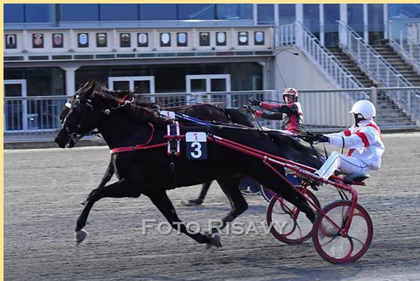
Wehrt Rammstein abermals alle Angriffe der Konkurrenz ab?

In aktueller Form sollte man meinen das Rammstein keine Gegner fürchten muss, doch hatte ihn bereits beim letzten Antreten Love You Venus ordentlich auf den Zahn gefühlt und kann vielleicht diesmal den Spieß umdrehen. Innerhalb sind nämlich mit den schnellen Beginnern Somebody's Diamond, Power BMG und La Condesa gleich drei Mitkonkurrenten des Action Ferrari-Sohns zu finden die in der Anfangsphase viel Kraft kosten können. Neben Favorit Rammstein und Herausforderer Love You Venus gibt es also noch andere mögliche Sieganwärter die von Positionskämpfen profitieren könnten.